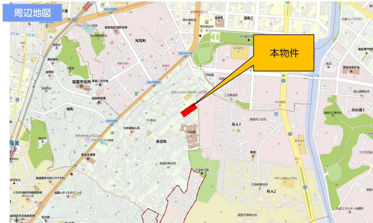
ナビ：塩釜市新富町4-13付近