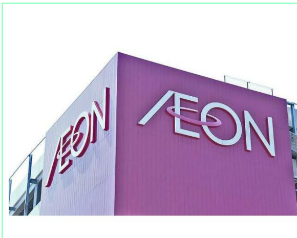
イオンモール新利府