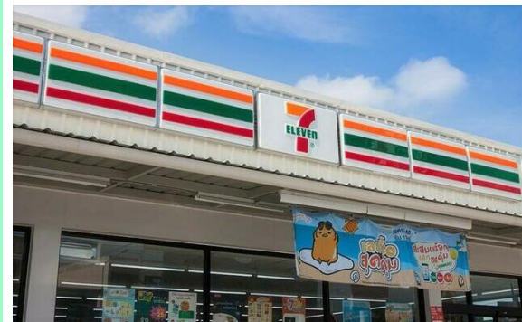
セブンイレブン塩釜庚塚店