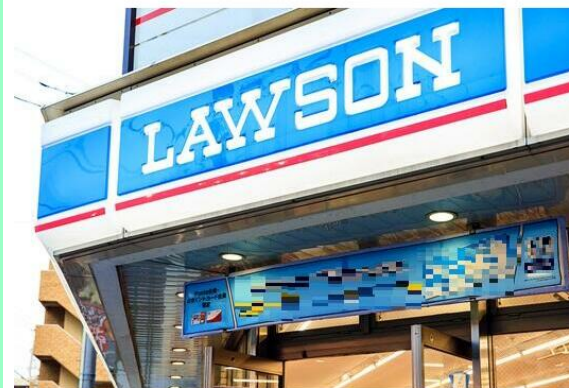
ローソン塩釜清水沢店