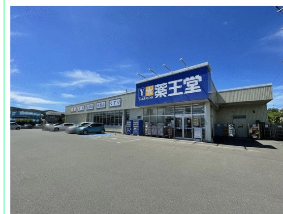
薬王堂仙台泉館店 徒歩2分

※この図面はATBBの物件情報の一部を抜粋して掲載しております。(現況優先) ※入居日・引渡日変更や付帯条件、別途料金が発生する場合がありますのでご確認ください。